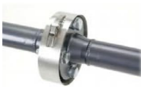
Nerezový pás s kovovou tkaninou, materiál SS 316